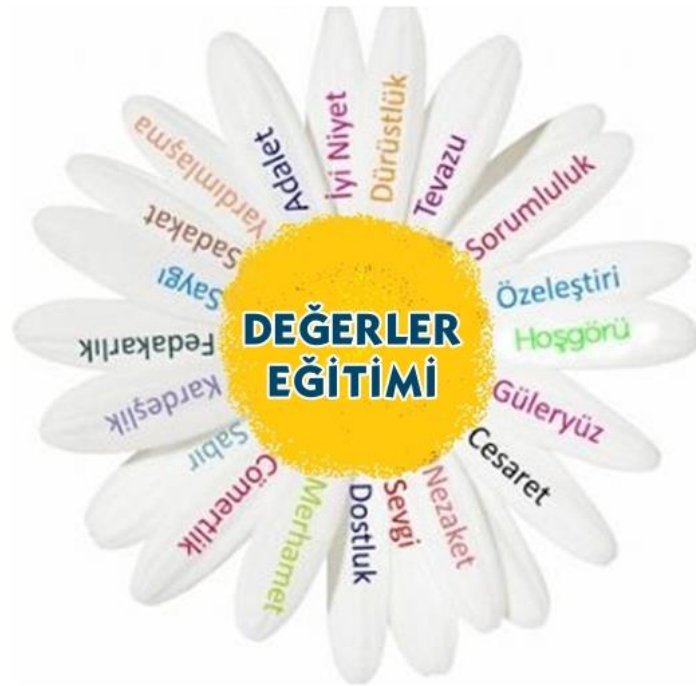
Şekil 1. Değerler ve eğitimi.

Tablo 2’de verilen temalar, aşağıda başlıklar halinde ilgili araştırma soruları ve ilgili görüşme formu soruları paralelinde sunulmaktadır. Katılımcıların görüşme sorularına verdikleri cevaplar gruplandırılarak tablolar ile sunulmuştur. Ardından da katılımcı görüşlerinin doğrudan alıntılanması ile açıklanmıştır. Bulguların belirtilmesinden önce ise, değerler eğitimi aşağıda görselleştirilerek hatırlatılmıştır (Şekil 1).